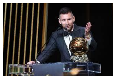
první vítěz Stanley